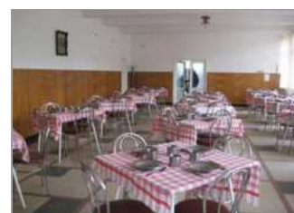
Cămin-internat și Cantină