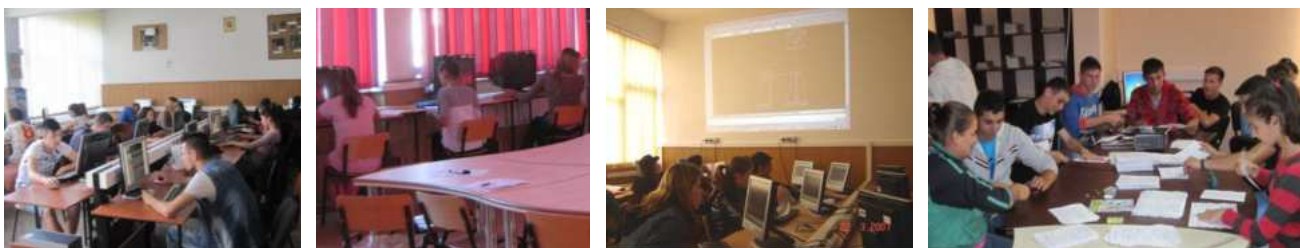
Laboratoare de informatică (AEL, ECDL, CAD, BV)