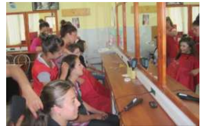
Salon de coafură