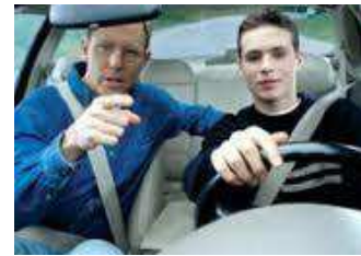
Școala de șoferi