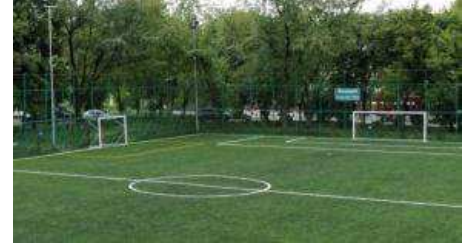
Sală de sport și teren de sport cu gazon sintetic

L.T. "G-ral Magheru" Rm.-Vâlcea are școală de șoferi , autorizată ARR și dispune de un autoturism Dacia Logan, pentru efectuarea pregătirii practice auto și de Cabinet de legislație rutieră, pentru efectuarea pregătirii teoretice, în vederea obținerii permisului de conducere auto, categoria B, pentru calificarea tehnician electrician auto, pentru care suntem acreditați.