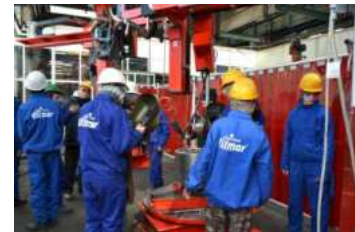
Practica se desfășoară la agenții economici