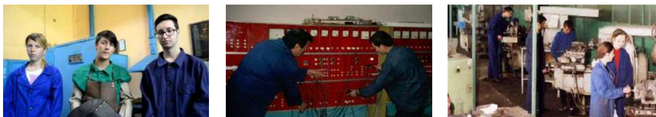
Ateliere (sudură, electric, strungărie)

Liceul nostru este printre puținele școli din țară care are, într-o clădire specială , un atelier de prelucrări mecanice cu utilaje funcționale (strunguri, freze, raboteze și alte mașini unelte) și un atelier de sudură cu 10 posturi de sudură , extrem de utile pentru formarea profesională a elevilor. De asemenea în această clădire există și atelier de lăcătușerie , prevăzute cu bancuri de lucru, atelier de electrotehnică și electronică și salon de cofură dotat pentru pregătirea elevilor de la calificarea Coafor stilist .