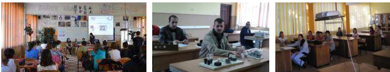
Laboratoare (tehnologic-multimedia, electrotehnică, fizică)