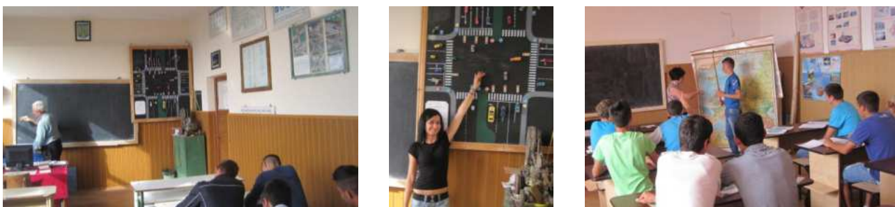
Cabinete (legislație, geografie)